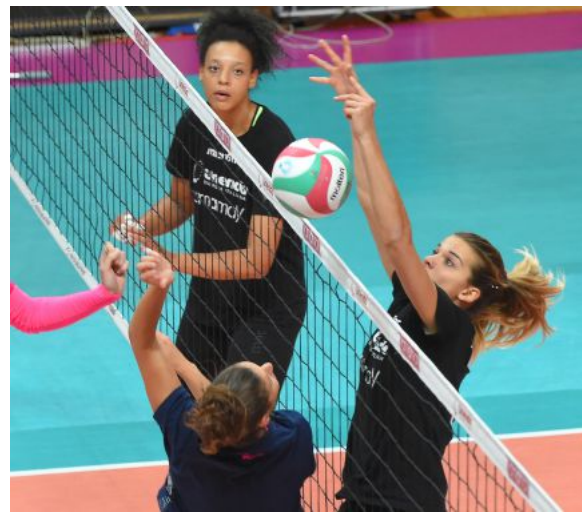
Due immagini del test amichevole disputato mercoledì al PalaYamay dalla Uyba di Marco Mencarelli contro la Igor Novara