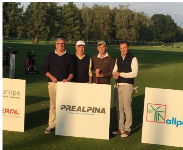
Il team Prealpina che ha gareggiato al Gc Monticello

GOLF Spettacolare e divertente gara al Gc Monticello, in lizza anche il team Prealpina