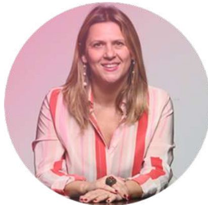
ADELAIDE EVENT MANAGER

Tre grandi passioni ci uniscono così nella vita, come nel lavoro.